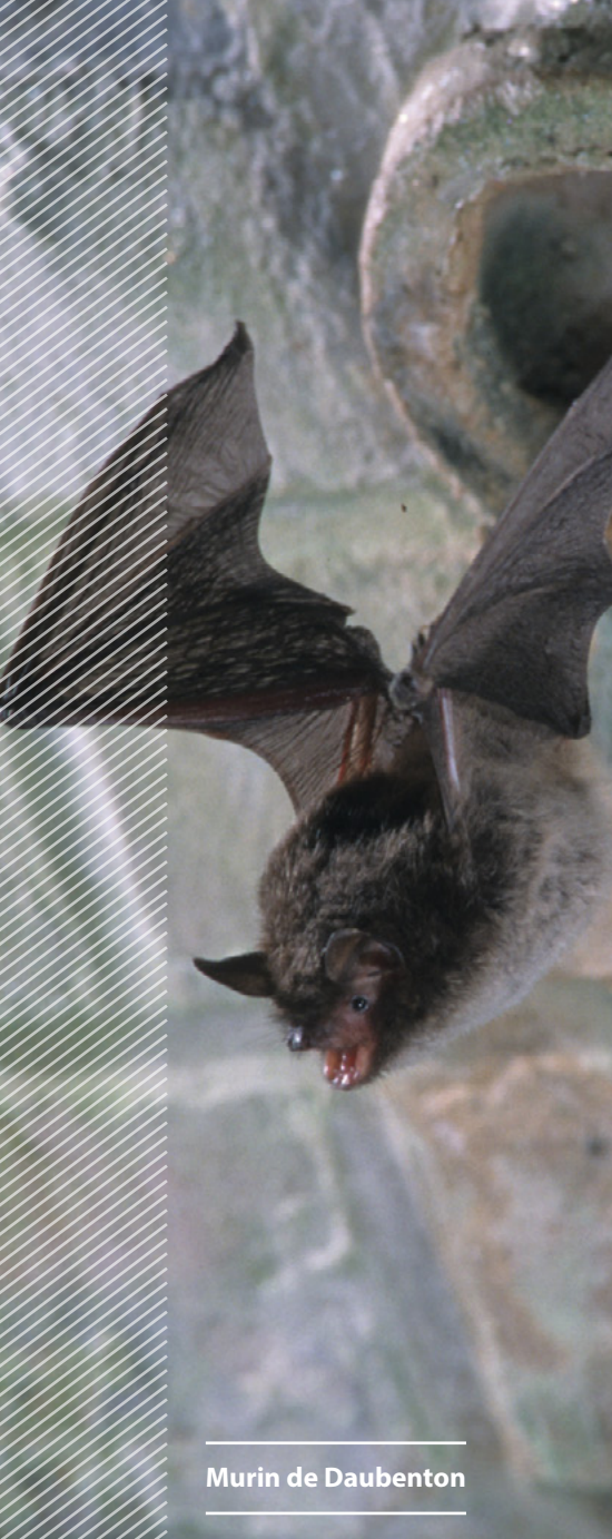
Murin de Daubenton