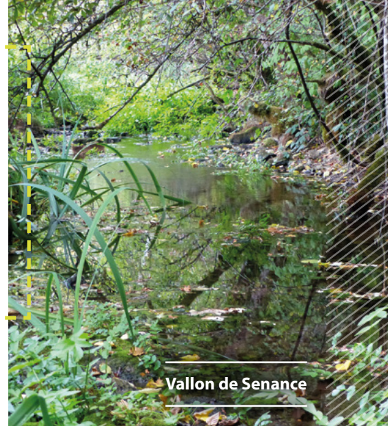
Vallon de Senance

L'année 2020 s'est terminée sur un bilan sud haut-marnais très positif en matière de protection avec 10 nouveaux sites (plus de 90 ha) et le renouvellement de partenariat sur 6 sites. Des résultats qui illustrent la reconnaissance des compétences du Conservatoire, acteur incontournable de la préservation et la gestion des espaces naturels, et la relation de confiance qui a pu s'instaurer avec les propriétaires, au premier rang desquels les communes et leurs élus.