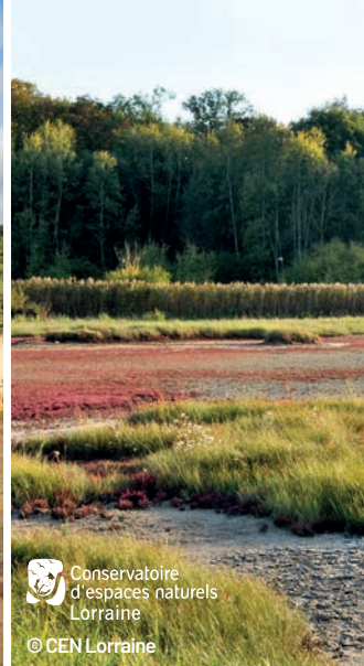
Conservatoire d'espaces naturels Lorraine