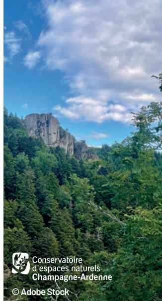
Conservatoire d'espaces naturels Champagne-Ardenne

Parmi les nouveautés réglementaires, un Conseil scientifique commun succède aux conseils scientifiques autrefois propres à chaque Conservatoire, et en regroupe les anciens membres.