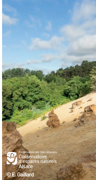
Conservatoire des Sites Alsaciens Conservatoire d'espaces naturels Alsace