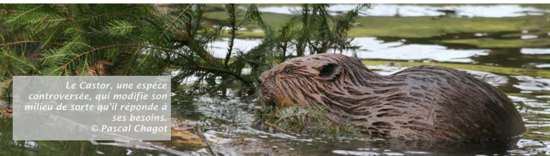
Le Castor, une espèce controversée, qui modifie son milieu de sorte qu'il réponde à ses besoins.