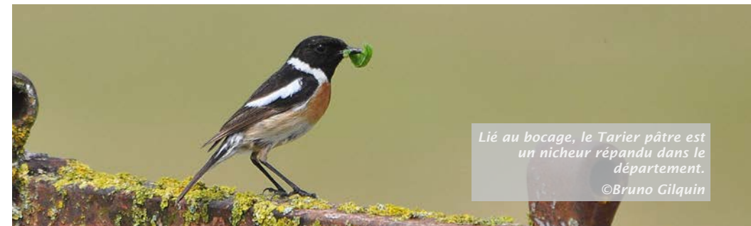
Lié au bocage, le Tarier pâtre est un nicheur répandu dans le département.