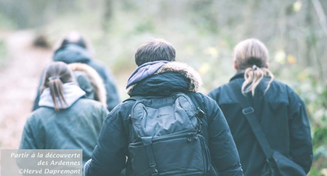
Partir à la découverte des Ardennes