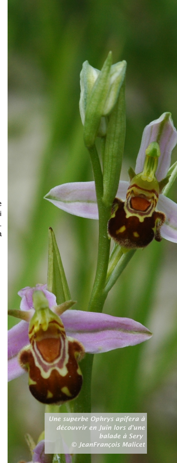
Une superbe Ophrys apifera à découvrir en Juin lors d'une balade à Sery

> 00.32.475.75.25.37 ou viroinvol@skynet.be (Thierry Dewitte)