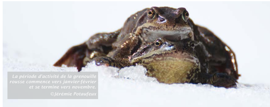
La période d'activité de la grenouille rousse commence vers janvier-février et se termine vers novembre.