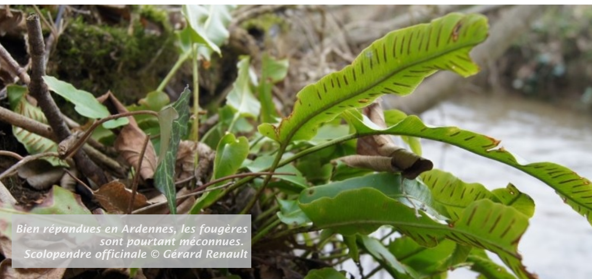
Bien répandues en Ardennes, les fougères sont pourtant méconnues. Scolopendrella officinalis