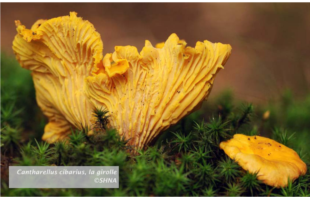
Cantharellus cibarius, la girolle

Prix : 5€/adulte, 3€/enfant, 12€/famille.