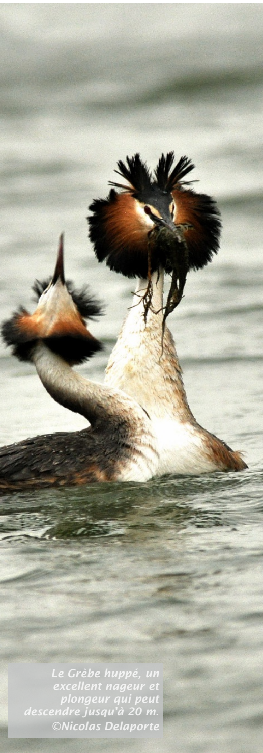
Le Grèbe huppé, un excellent nageur et plongeur qui peut descendre jusqu'à 20 m.