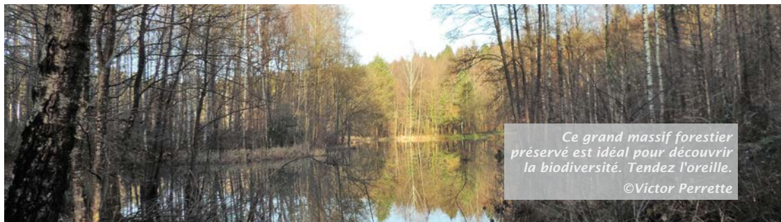
Ce grand massif forestier préservé est idéal pour découvrir la biodiversité. Tendez l'oreille.