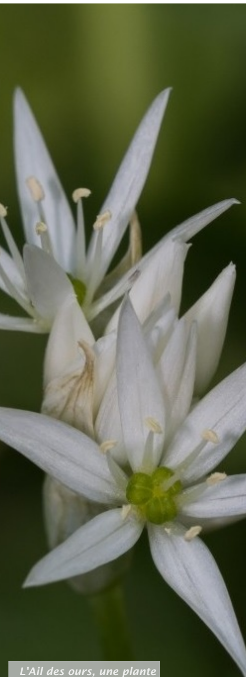
L'Ail des ours, une plante sauvage à déguster en ce début de printemps.