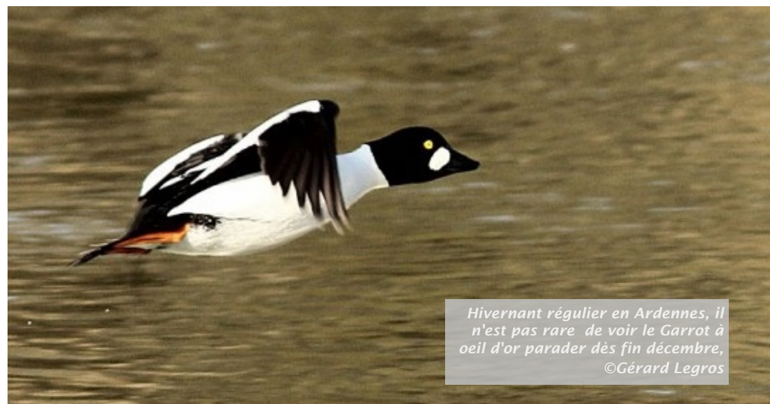
Hivernant régulier en Ardennes, il n'est pas rare de voir le Garrot à oeil d'or parader dès fin décembre