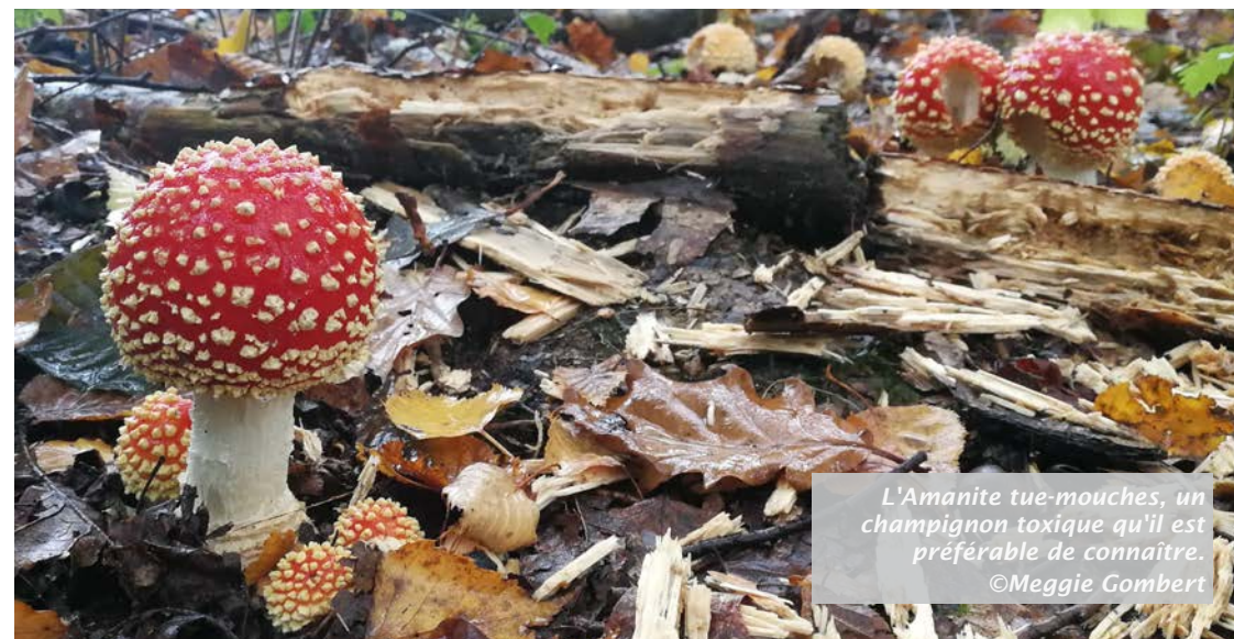
L'Amanite tue-mouches, un champignon toxique qu'il est préférable de connaître.

Prix : 5€/adulte, 3€/enfant, 12€/famille.